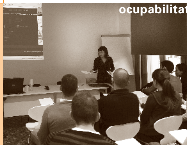
Fotografia i coberta: Lorenzo Fuentes

tat, i d'incloure més opcions, com la possibilitat de descarregar el programa en format pdf.