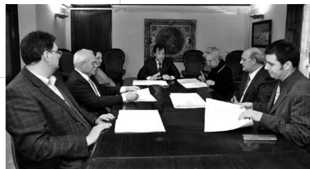
Signatura del conveni entre la Demarcació de Barcelona i Metro 3 el 12 de març de 2009

Els avantatges contemplats en el conveni complementen la campanya de Metro-3, SA Garantia del millor preu , que assegura als compradors un abonament en cas que l'empresa redueixi els preus de la resta d'habitatges de l'edifici, des del moment de la compra fins al 2011.