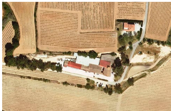
Celler Eudald Massana (Sant Pau d'Ordal) Maset del Lleó

Industrial i magatzem: 1.139m 2 Residencial: 441m 2