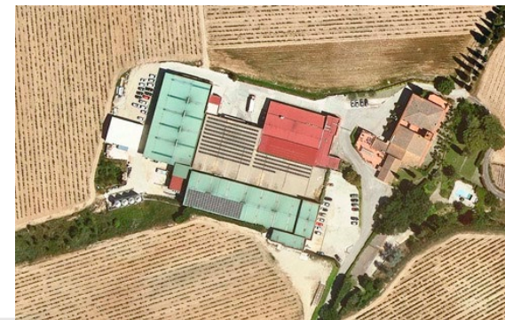
Sumarroca (El Rebato) Molí d'en Coloma

Masia d'interès, celler i edifici industrial nou