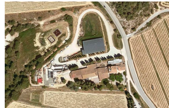
Albet i Noya (Sant Pau d'Ordal) Can Vendrell de la Codina

Industrial i magatzem: 2.723m 2 Residencial: 1.657m 2