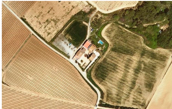
Celler Carol Vallès (Corral del Mestre) Masia Can Parellada

Industrial i magatzem: 320m 2 Residencial: 679m 2