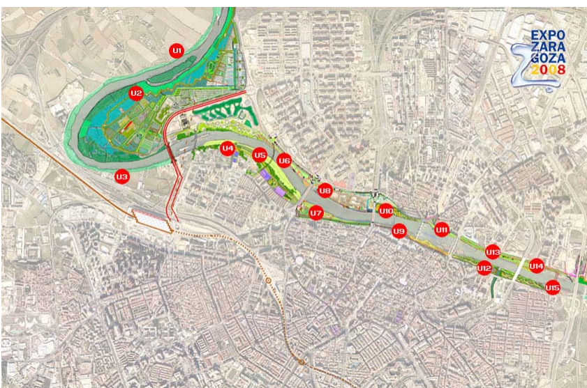
Pla de Riberes