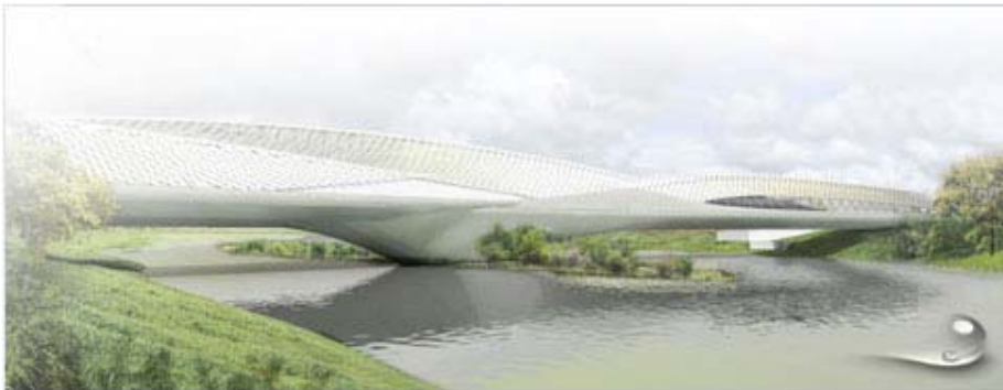
Pavelló Pont. Zaha Hadid