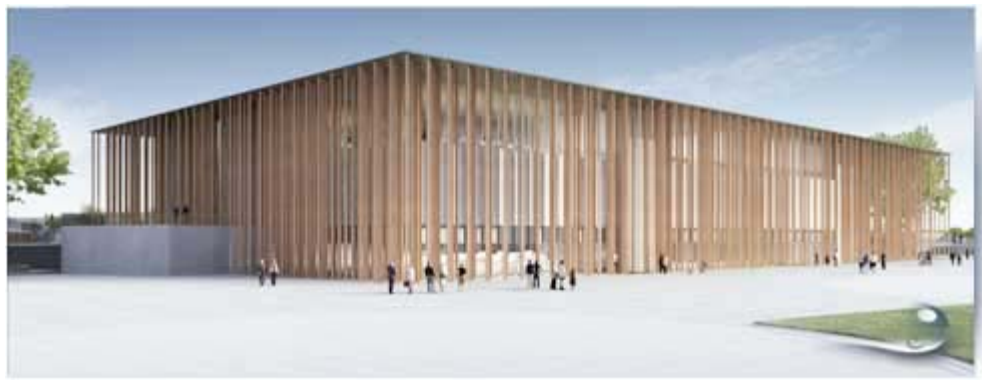
Pavelló d'Espanya. Francisco Mangado