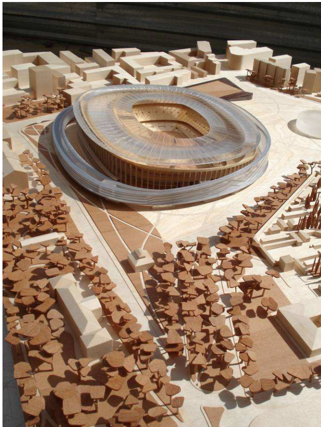
Maqueta del proyecto Nuevo Camp Nou. Para descargar la imagen en alta resolución clicar sobre ella.