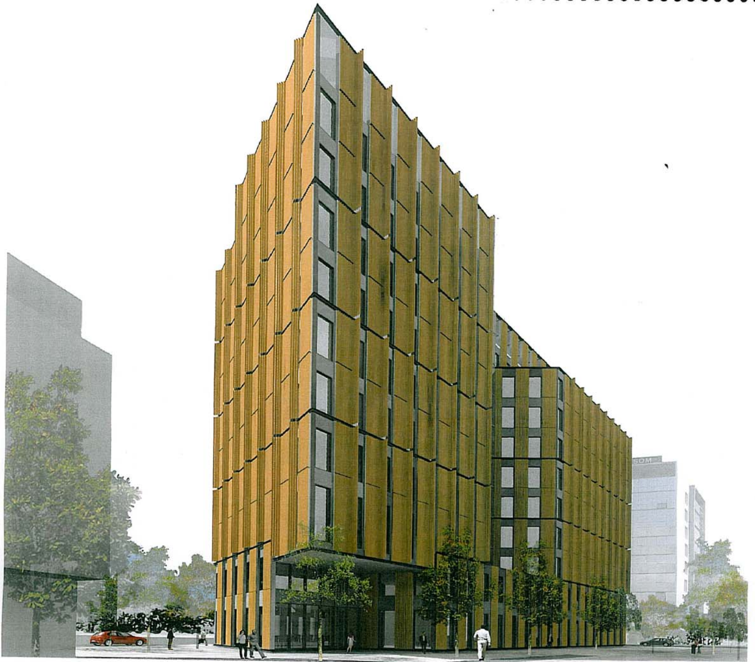
VISTA DES DE L'ESPAI ENJARDINAT