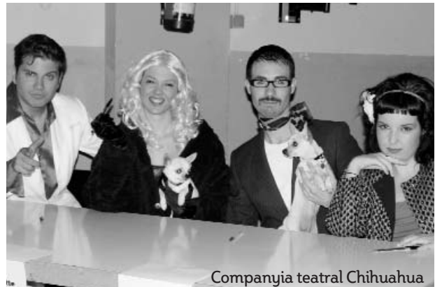
Companyia teatral Chihuahua

ta obra els organitzadors han volgut allunyar-se dels tradicionalismes i han optat per oferir als ciutadans la possibilitat de participar en l'obra. És per aquest motiu que dilluns passat les instal·lacions del Mercat Vell van rebre un càsting, a l'estil dels del conegut programa televisiu Operación Triunfo , per tal de seleccionar a aquells ciutadans que millor s'adaptin al perfil que busca la companyia del musical.