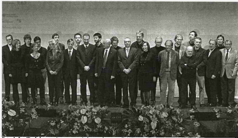
Foto de familia de los arquitectos premiados con los consellers Treserras, Tura y autoridades. RICARD DOMÈNECH