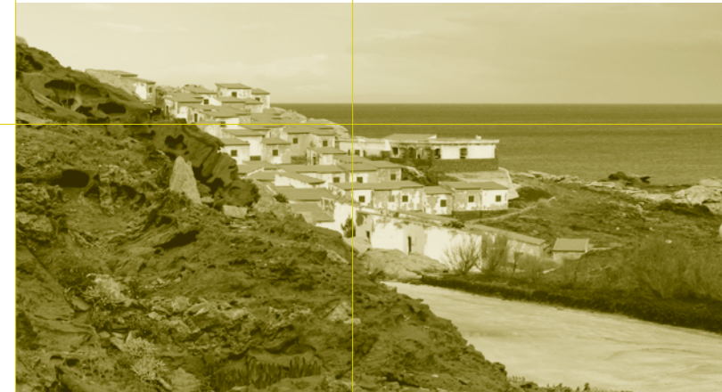
Club Mediterranée de Cadaqués. Abril 2006. Fons CDI.