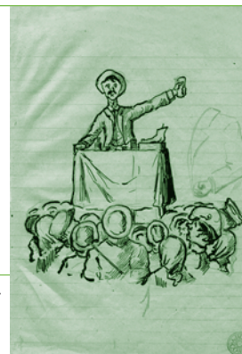
Dibuix de Rafael Masó. Fons del COAC.