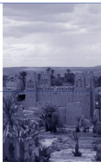
Arquitectura, tierra y palmeras en Skoura