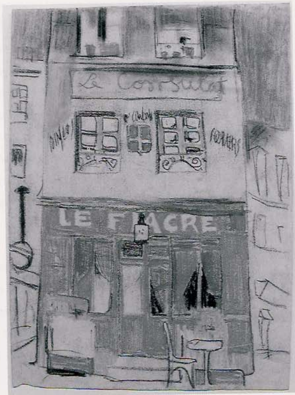
Núm: 5655 – Mides: 45 x 32.5 cm – Marc: 60 x 75 cm

El Museu Comarcal de la Garrotxa, en col·laboració amb el Col·legi d'Arquitectes de Catalunya – Delega-