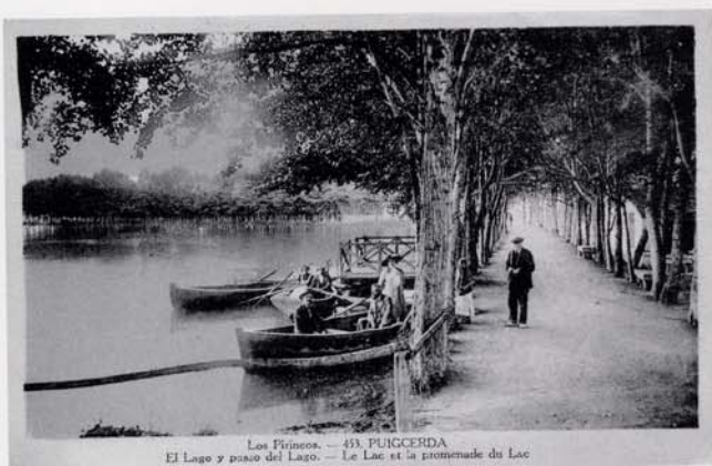
Los Pirineos. — 453. PUIGCERDÀ. El Lago y paseo del Lago. — Le Lac et la promenade du Lac