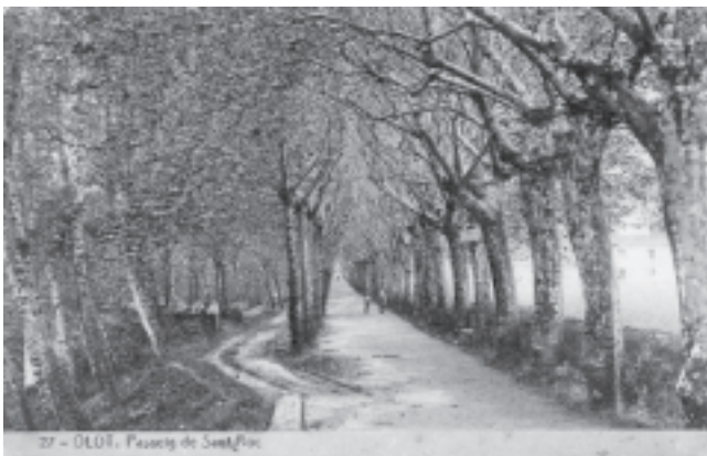
27 - OLOT. Passeig de Sant Roc

Passeig de Sant Roc. Olot.  Reg. 18306