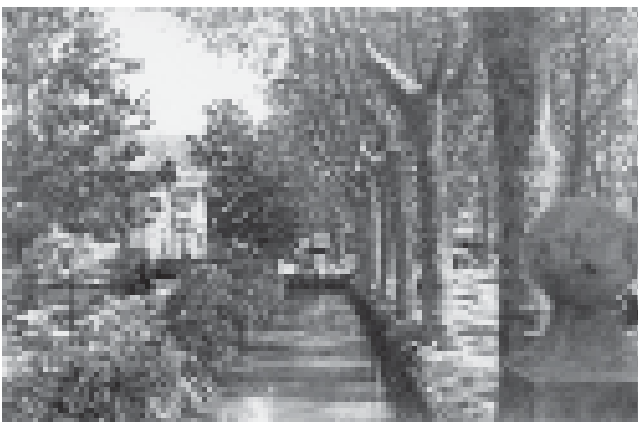
Parc de la Devesa. Girona.