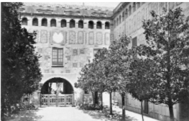
Pati de l'Hospital de Santa Caterina de Girona, c.1930. Reg. 19700.