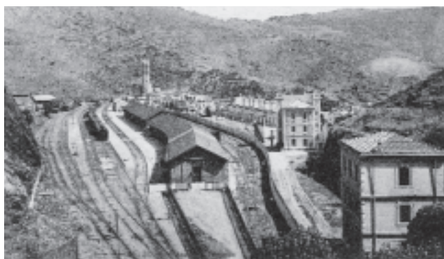
Estació de Portbou, 1878. Fons de postals de l'Arxiu Històric de la Demarcació de Girona del Col·legi d'Arquitectes de Catalunya (AHCOAC). Reg. 3049.

A la imatge podeu veure una vista general exterior de l'estació internacional de Portbou a l'any 1878, panoràmica força diferent a l'actual sobretot si tenim present l'arribada properament del tren d'alta velocitat a les nostres comarques.