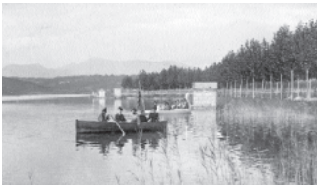
Vista general de l'Estany de Banyoles. c.1910. Reg. 17717.

A la imatge es pot veure una vista parcial exterior de l'estany de Banyoles a principis de segle XX. Es pot comprovar que el paisatge és molt diferent a l'actual, sense gaires elements arquitectònics.