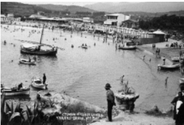
Banys de S'Agaró. Sant Feliu de Guíxols.