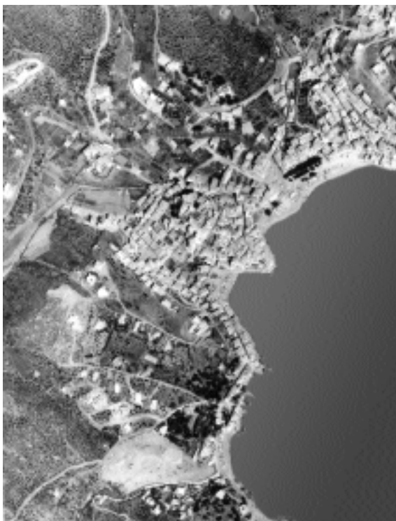
Fotografia Aèria de Cadaqués.