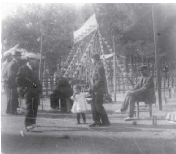
Atraccions instal·lades en motiu de les Fires de Girona: "El Columpio Americano". Agost de 1914.