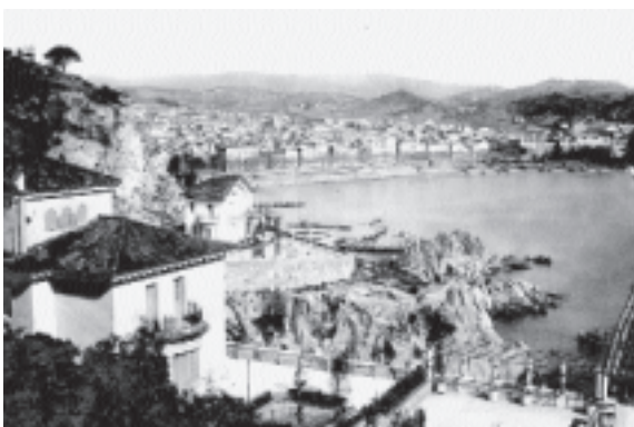
Xalets de la Urbanització de Sant Elm. Sant Feliu de Guíxols.