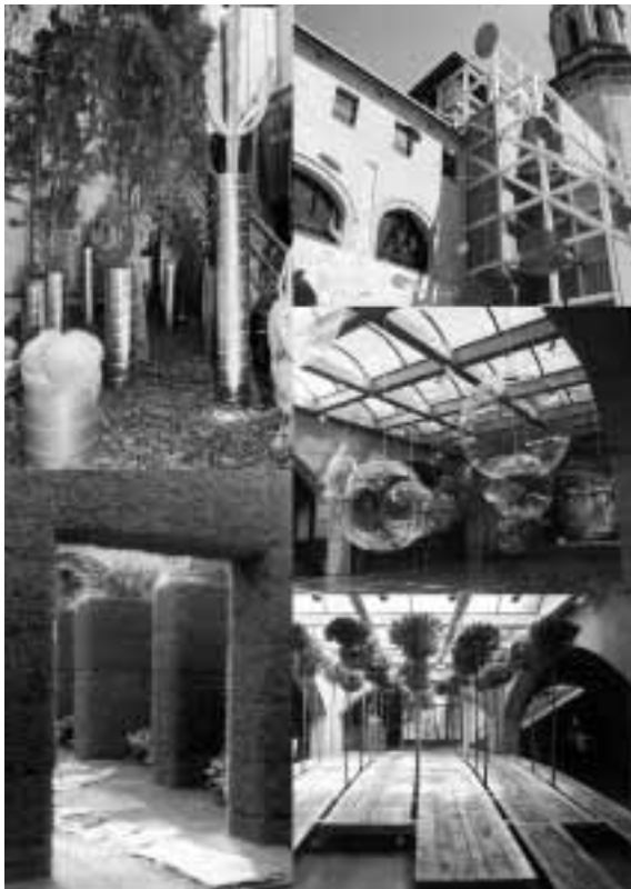
Intervencions efímeres a la Pia Almoina durant "Girona, temps de flors". 1998-1999, 2001-2003.