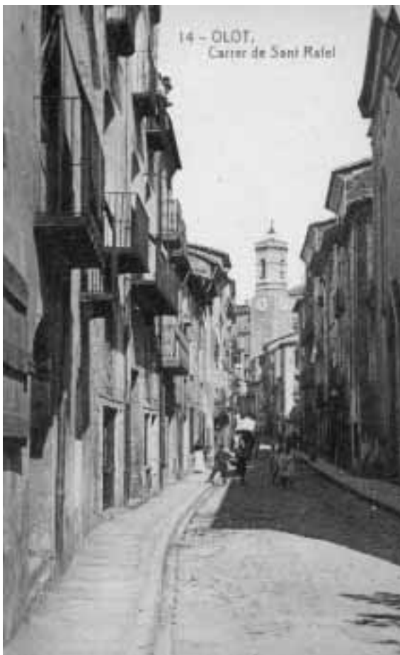
Carrer de Sant Rafael a Olot. Reg. 18312.