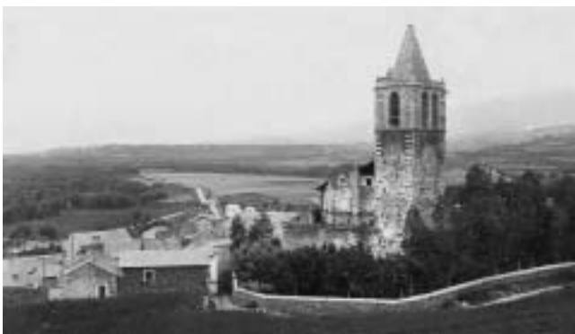
Església de Llivia.