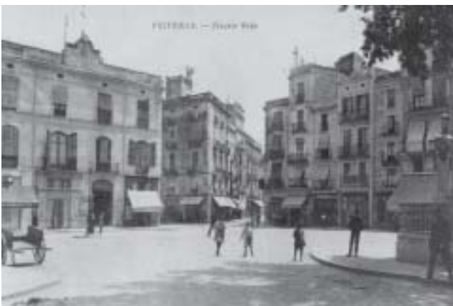
Vista general de la Placeta baixa de Figueres.