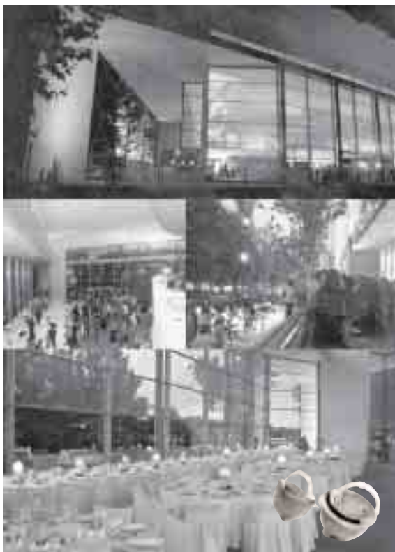
Festa Patronal 2005. Auditori de Girona en construcció.