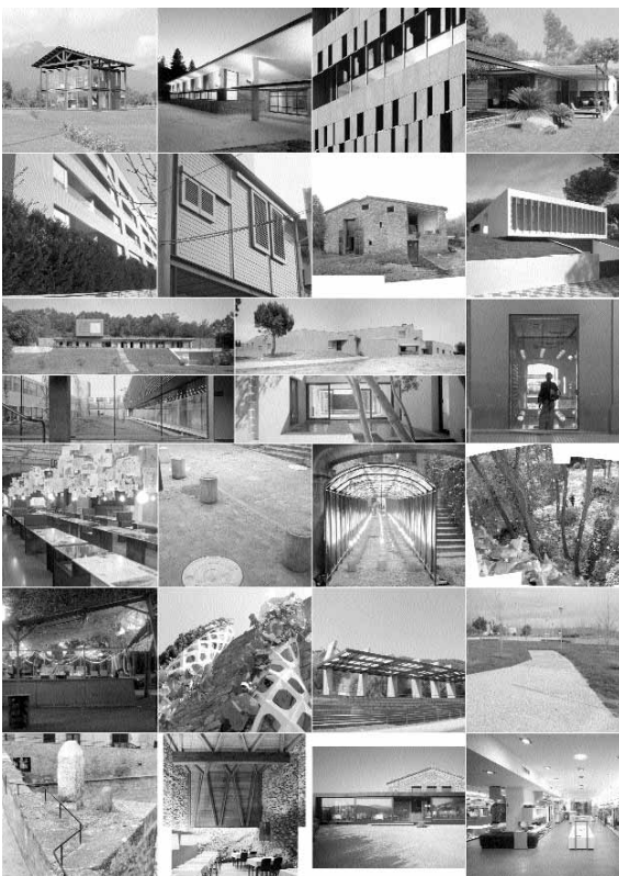
Obres seleccionades. Premis d'Arquitectura de les comarques de Girona 2005