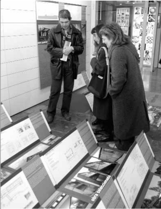
1. Premis d'arquitectura de les comarques de Girona. Delegació Alt Empordà