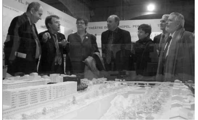
3. Concurs del Teatre de l'Archipel de Perpinyà. Demarcació de Girona