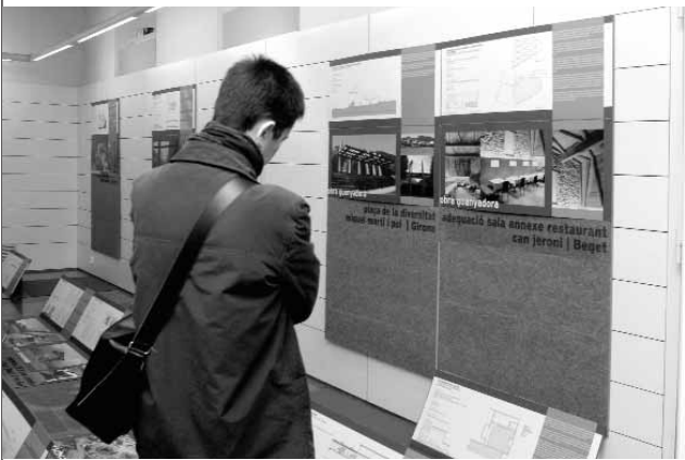
2. Presentació del llibre l'Arquitecte, l'arquitectura i la ciutat: Girona 1760-1835. Ajuntament de Girona