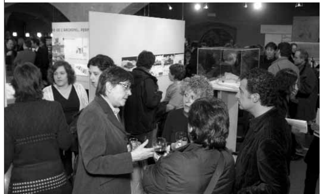
4. L'art romànic de Jean Dieuzaide. Delegació Garrotxa-Ripollès.