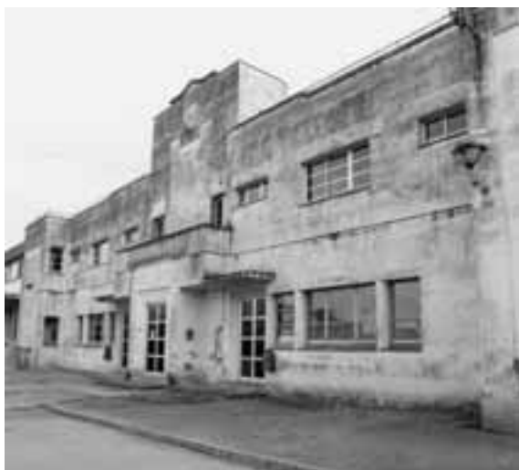
Escoles de Flaça (actualment CEIP Les Moreres) d'Emili Blanch, arquitecte. Reg. 3331.