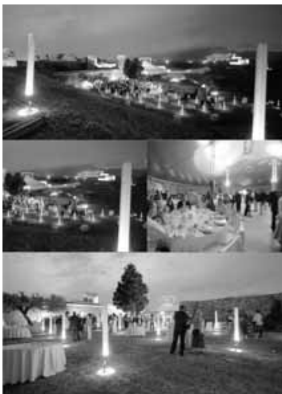
Festa Patronal dels Arquitectes. Ciutadella de Roses.