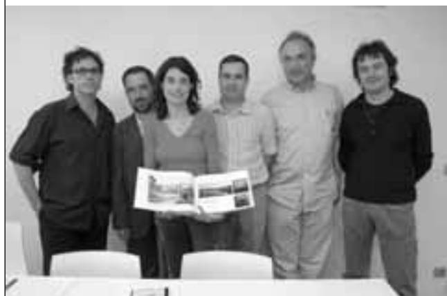
Exposició A+PS. Delegació Garrotxa-Ripollès