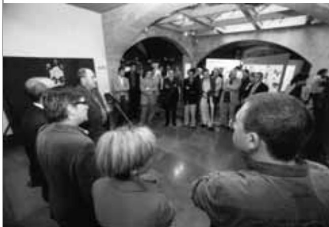
Festa patronal a la Ciutadella de Roses. COAC Girona