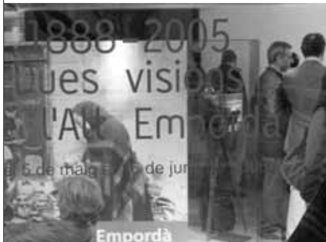
Dues visions de l'Alt Empordà. Delegació de l'Alt Empordà