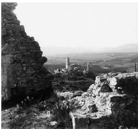
Perspectiva de la ciutat de Girona amb els campanars de la Catedral i l'església de Sant Feliu. Primer terç segle XX. Rafael Masó. AHCOAC, Fons Rafael Masó. R. 22885

Rajola mugró. Edifici Athenea de Girona (enderrocat l'any 1975). Obra de Rafael Masó. Pia 90. Juliol / Agost 2007