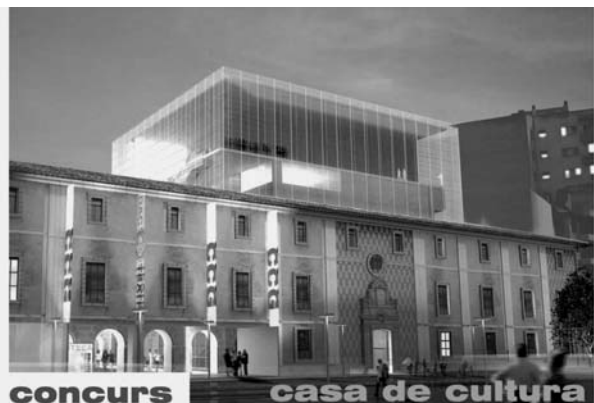
concurs casa de cultura