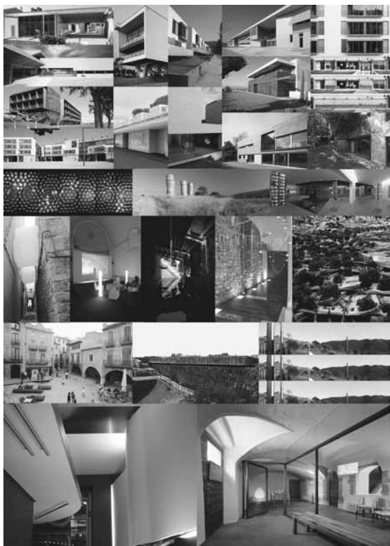
Projectes seleccionats. Premis d'Arquitectura de les comarques de Girona 2007

Rebedor de la Casa Masó. Obra de Rafael Masó. Pia 93 Novembre 2007