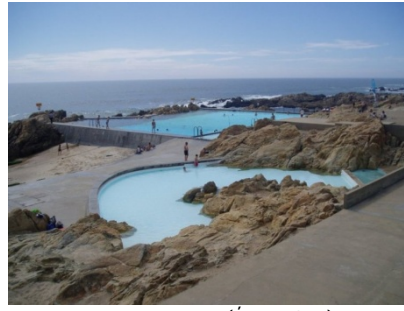
Piscina das marés de Leça (Álvaro Siza)