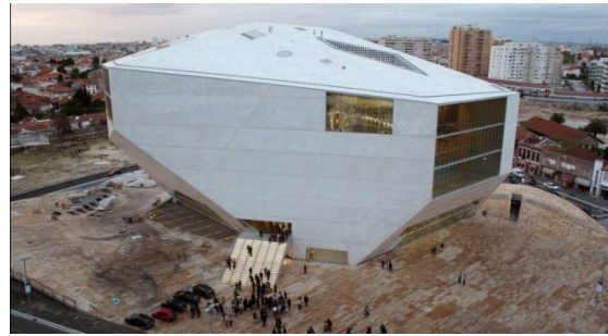
Casa da Música (OMA, Rem Koolhaas)