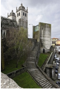
Casa dos 24 (Fernando Távora)