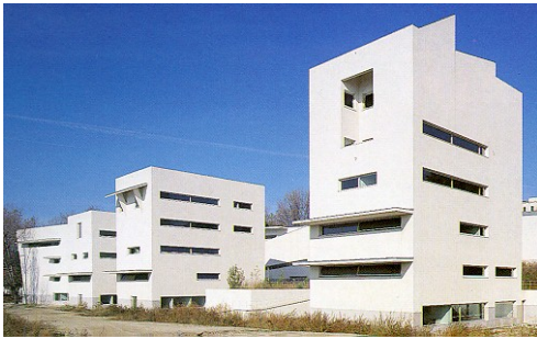
Facultat d'Arquitectura de Oporto (Siza)