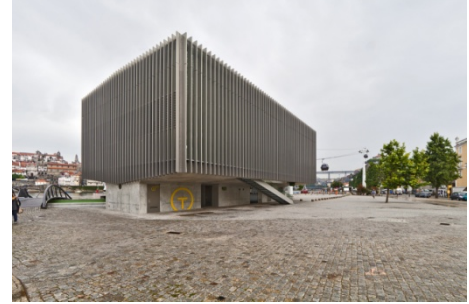
Gaia Cable Car (Cristina Guedes i Francisco Vieira Campos)