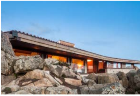
Casa de Chá da Boa Nova (Álvaro Siza)