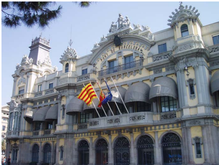
Portal de la Pau, seu APB.