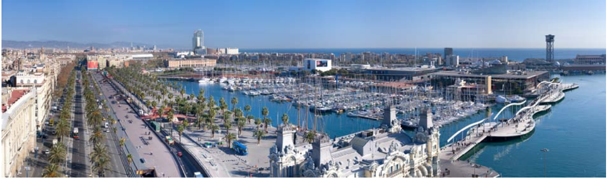
Vista del Port Vell.

AGRUPACIÓ D'ARQUITECTES PER A LA DEFENSA I LA INTERVENCIÓ EN EL PATRIMONI ARQUITECTÒNIC