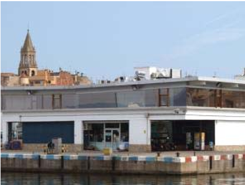
FOTOGRAFIA 8: Edifici de la Llotja des de l'Espai del Peix de Palamós.