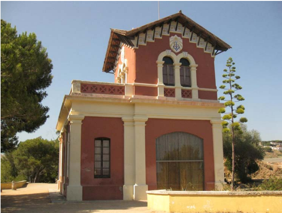
FOTOGRAFIA 3: Edifici del Salvament Marítim, Sant Feliu de Guíxols.