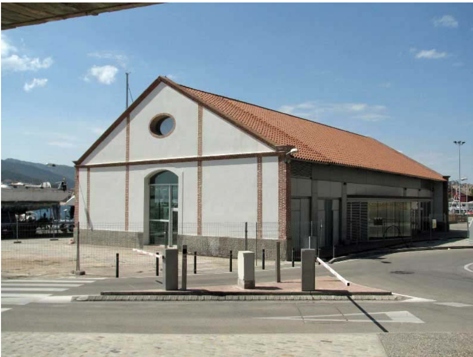
FOTOGRAFIA 4: Edifici del Tinglado, Sant Feliu de Guíxols.