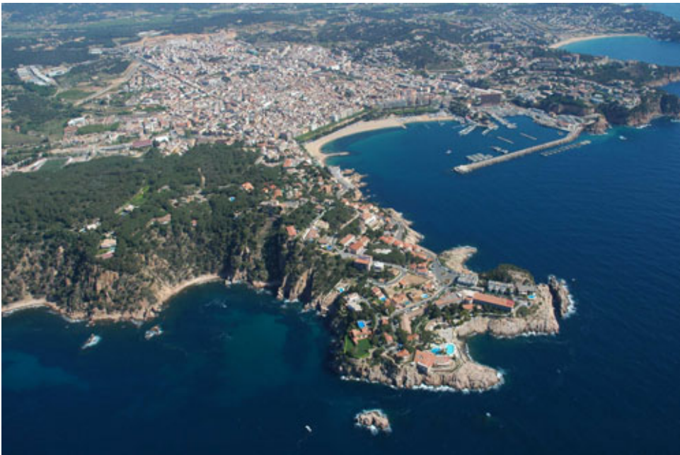
FOTOGRAFIA 2: Vista aèria de Sant Feliu de Guíxols.