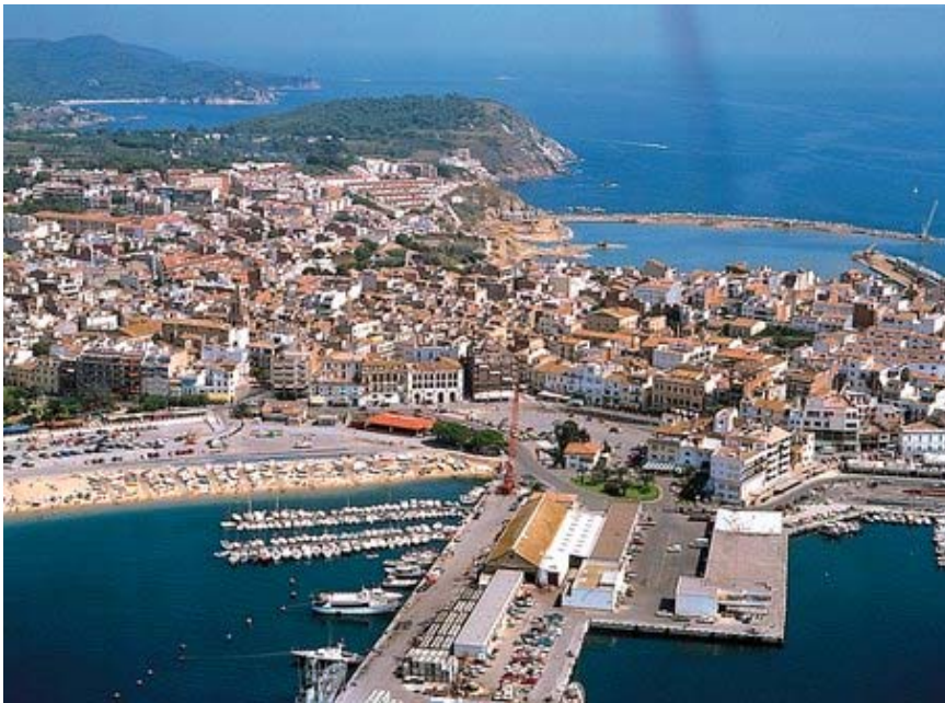
FOTOGRAFIA 6: Vista aèria de Palamós.