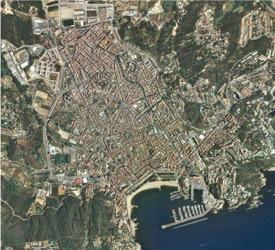
FOTOGRAFIA 1: Vista aèria de Sant Feliu de Guíxols. Font: Google Maps