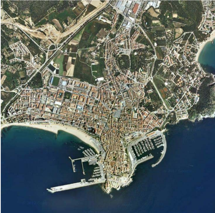
FOTOGRAFIA 5: Vista aèria de Palamós.