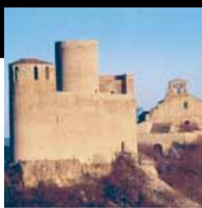
Col·legiata de Santa Maria de Mur i castell de Mur. Castell de Mur (Pallars Jussà)

Les imponents dimensions i la diversitat d'ocupants i usos de l'antiga Universitat de Cervera han anat condicionant les seves intervencions.