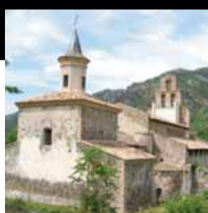
Església de Santa Maria de Gerri. Gerri de la Sal (Pallars Sobirà)

Un seguit d'intervencions de restauració i restitució a l'església romànica que es conserva de l'antic monestir de Santa Maria de Gerri.