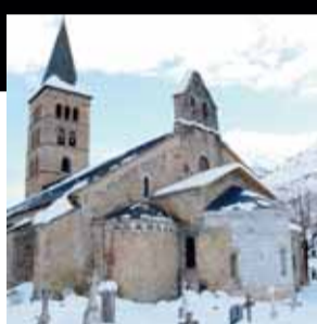
Església de Santa Maria d'Arties. Arties (Vall d'Aran)

Un seguit d'intervencions de restauració i restitució a l'església romànica que es conserva de l'antic monestir de Santa Maria de Gerri.