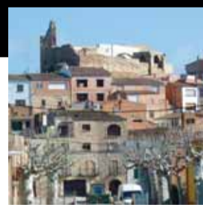
Castell de l'Albi. L'Albi (Garrigues)

Situat visiblement sobre un turó, el conjunt romànic de Mur ha sofert importants estudis i diferents intervencions que han de possibilitar-ne nous usos.