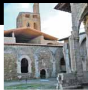
Castell i col·legiata de Sant Pere. Àger (Noguera)

Una intervenció de restauració integral en una de les nou esglésies romàniques de la Vall de Boí declarades patrimoni de la humanitat per la UNESCO.