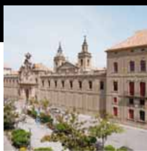
Edifici de la Universitat de Cervera. Cervera (Segarra)

Les imponents dimensions i la diversitat d'ocupants i usos de l'antiga Universitat de Cervera han anat condicionant les seves intervencions.