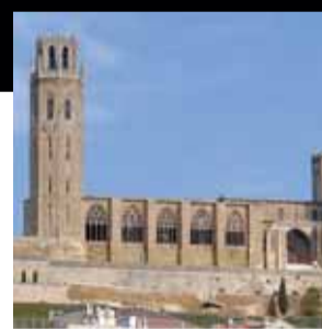
Seu Vella. Lleida (Segrià)

De l'estat de ruïna en què ens arriba als nostres dies a un bé amb restes recuperades, explicades i amb un nou ús com a centre cultural.