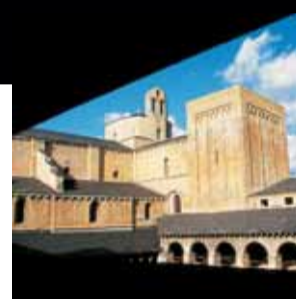
Catedral de Santa Maria de la Seu d'Urgell. Seu d'Urgell (Alt Urgell)

Representa la millor mostra del romànic aranès, relacionat amb el de la Vall de Boí. Les intervencions vénen determinades per les deformacions estructurals i les prospeccions arqueològiques.