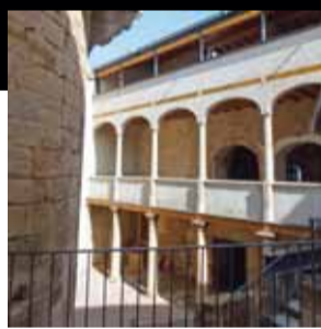
Castell de Verdú. Verdú (Urgell)

Un conjunt divers d'edificacions, amb una torre cilíndrica del s. XI com la més antiga, on s'ha consolidat la part adquirida per l'ajuntament amb la previsió d'adequar-la als usos definits al Pla Director.