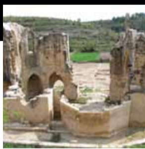
Santa Maria de Vallsanta. Guimerà (Urgell)

Un conjunt divers d'edificacions, amb una torre cilíndrica del s. XI com la més antiga, on s'ha consolidat la part adquirida per l'ajuntament amb la previsió d'adequar-la als usos definits al Pla Director.