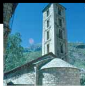
Església de Santa Eulàlia d'Erill la Vall. Erill la Vall (Alta Ribagorça)

Redescobriments de l'antic monestir de Vallsanta i consolidació d'urgència de les restes de l'edifici de l'església.