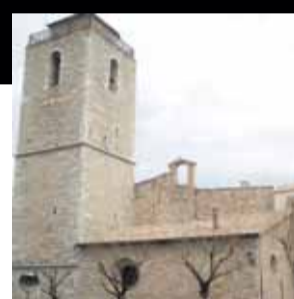
Església de Sant Llorenç de Morunys. Sant Llorenç de Morunys (Solsonès)

Un conjunt monumental amb clara influència del romànic italià i importants intervencions de restauració des de principis del segle XX.