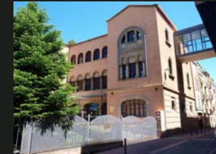
10 Hospital de St. Andreu visita guiada 11.30