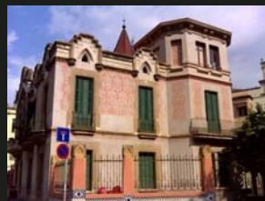
2 Casa Lluvià visita teatralitzada 10.00 - 11.00 - 12.00 visita guiada 10.30 - 11.30 - 12.30