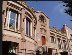
3 Casino de Manresa visita lliure interior i projeccions a la planta baixa 10.30 a 13.00