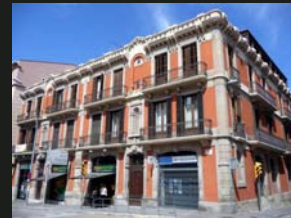
6 Casa Armengou visita d'espais autoritzats per la propietat 10.00 a 13.00