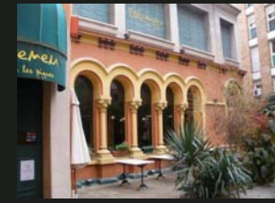
8 Ateneu Obrer Manresà visita lliure al pati