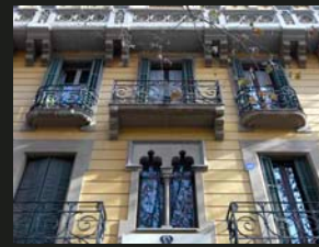
4 Casa Gabernet Espanyol visita del vestíbul 10.00 a 13.00