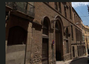
11 Companyia Anònima d'Electricitat visita guiada 12.30