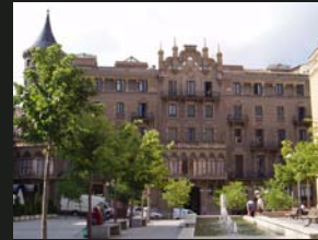
5 Casa Torrens Ca la Buresa visita d'espais autoritzats per la propietat 10.00 a 13.00