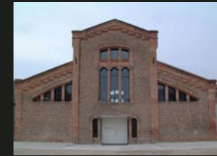
9 Escorxador Municipal visita guiada 10.30