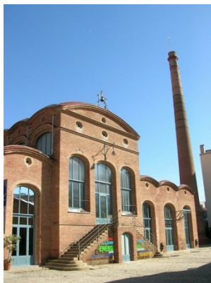
Vapor Aymerich, Amat i Jover