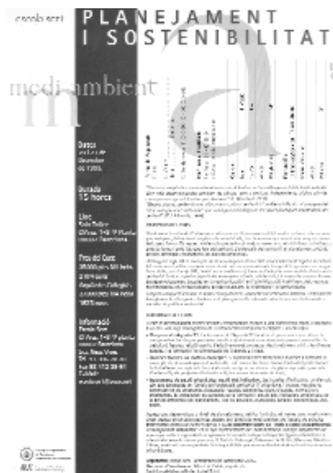
IN.01 Targetó del curs: “Planejament i Sostenibilitat”

Durant aquest segle que acaba, el concepte de desenvolupament ha estat inexcusablement lligat a la cultura del creixement, a l'ús i el consum creixents de sòl, recursos naturals, temps de les persones i energia.