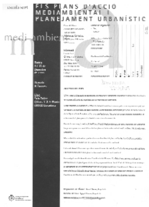
IN.02 Targetó del curs: “Els Plans d'Acció Mediambiental i Planejament Urbanístic”.