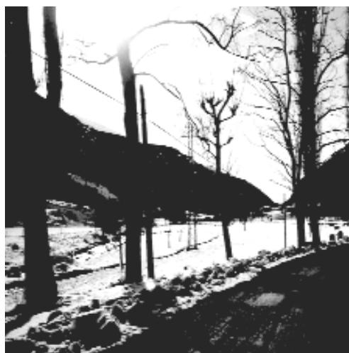
02.01 La Vall Fosca. Pirineu.