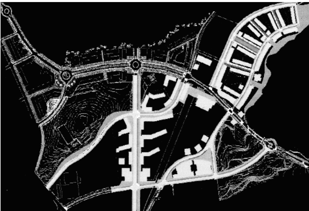
10.06 El Pla Parcial de Can Llong.