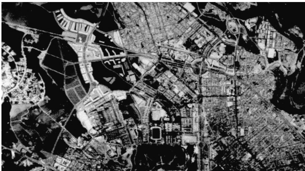
10.02 El barri de Can Llong i la ciutat construïda.