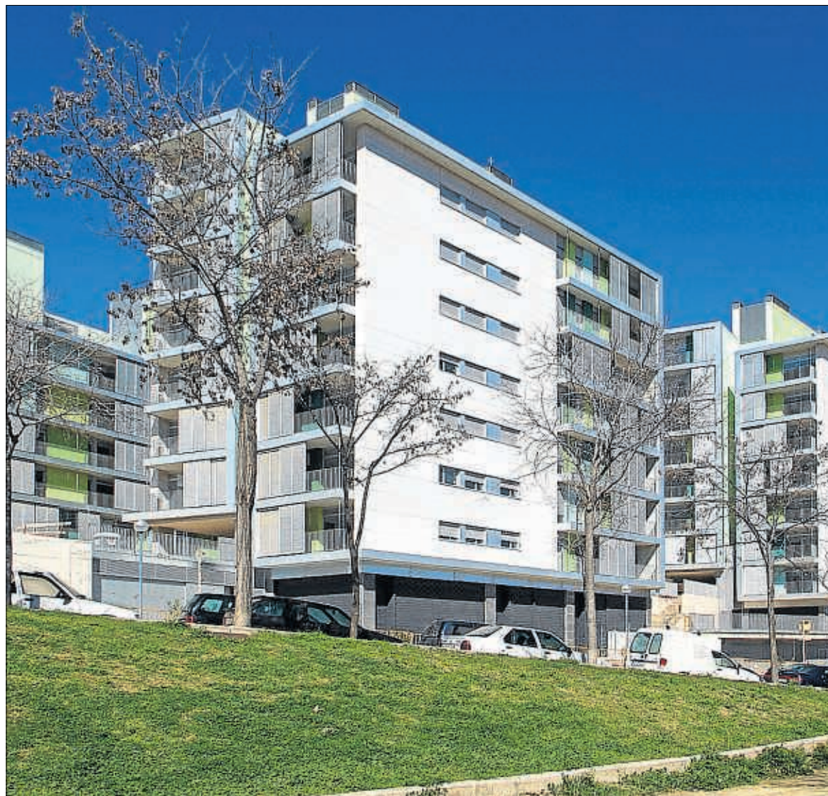
L'estimació per als propers anys és que no se superarà la ràtio de tres habitatges per arquitecte a l'any

La tendència descrita és el resultat d'un increment molt més gran de titulats que el cíclic augment d'activitat al sector. Per tant, sense turbulències, sense pics excessius ni crisis sistèmiques com l'actual, la tendència seria la mateixa, per això la situació no canviarà significativament quan es produeixi una raonable recuperació del sector.